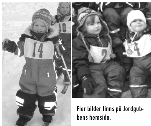
Fler bilder finns på Jordgubbens hemsida.

Har du frågor så ta chansen och ställ dem på föräldramötet den 7/4.